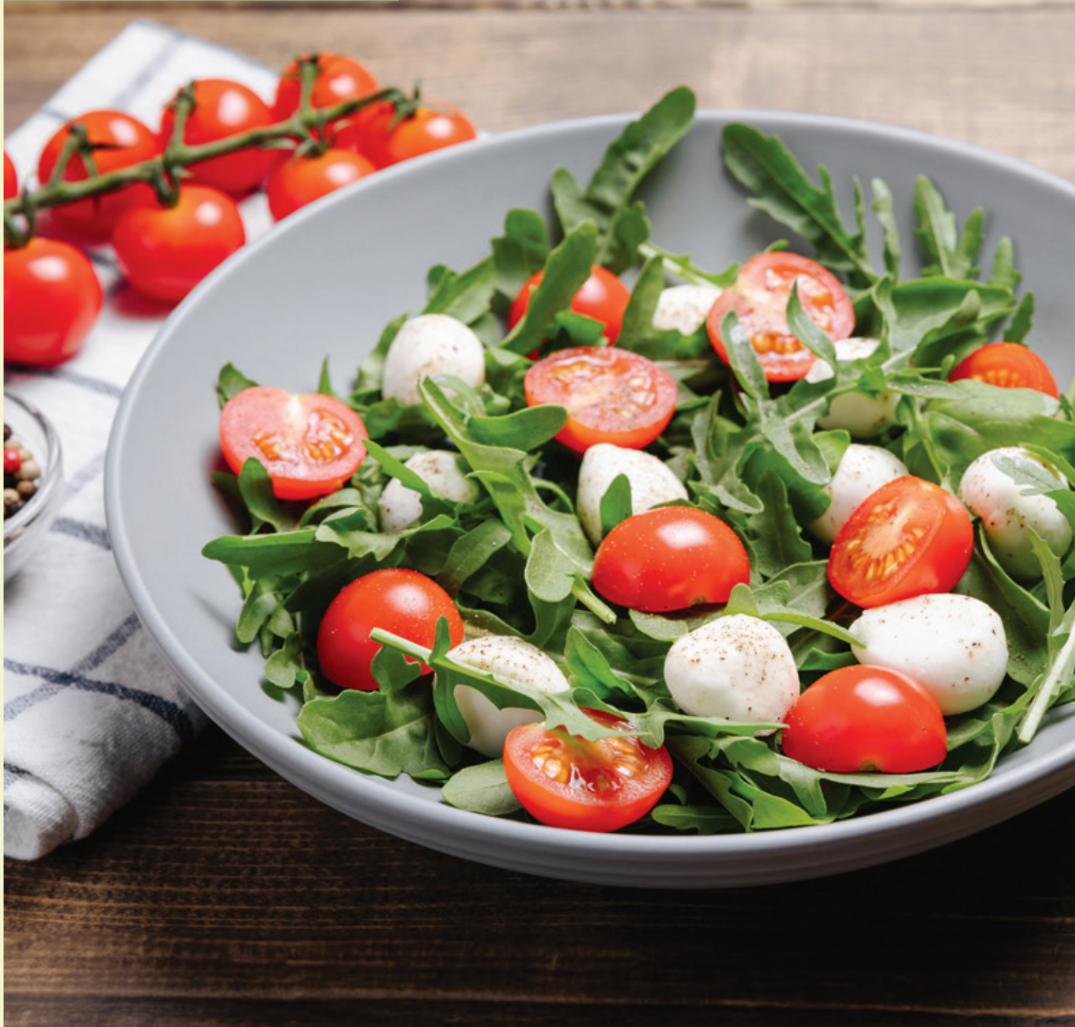
Immagine non contrattuale.