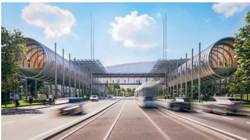
Il futuristico CERN Science Gateway è stato progettato da Renzo Piano.