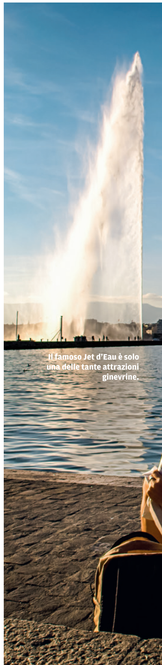
Il famoso Jet d'Eau è solo una delle tante attrazioni ginevrine.

Ginevra è una città museale e ha molte opzioni da offrire anche in caso di maltempo. Al Museo internazionale della Croce Rossa e della Mezzaluna, le visitatrici e i visitatori possono esplorare gli emozionanti 150 anni di storia dell'organizzazione umanitaria. Il Museo Patek Philippe offre una panoramica sull'arte dell'orologeria. Se volete saperne di più su Calvino e il Protestantismo, andate invece al