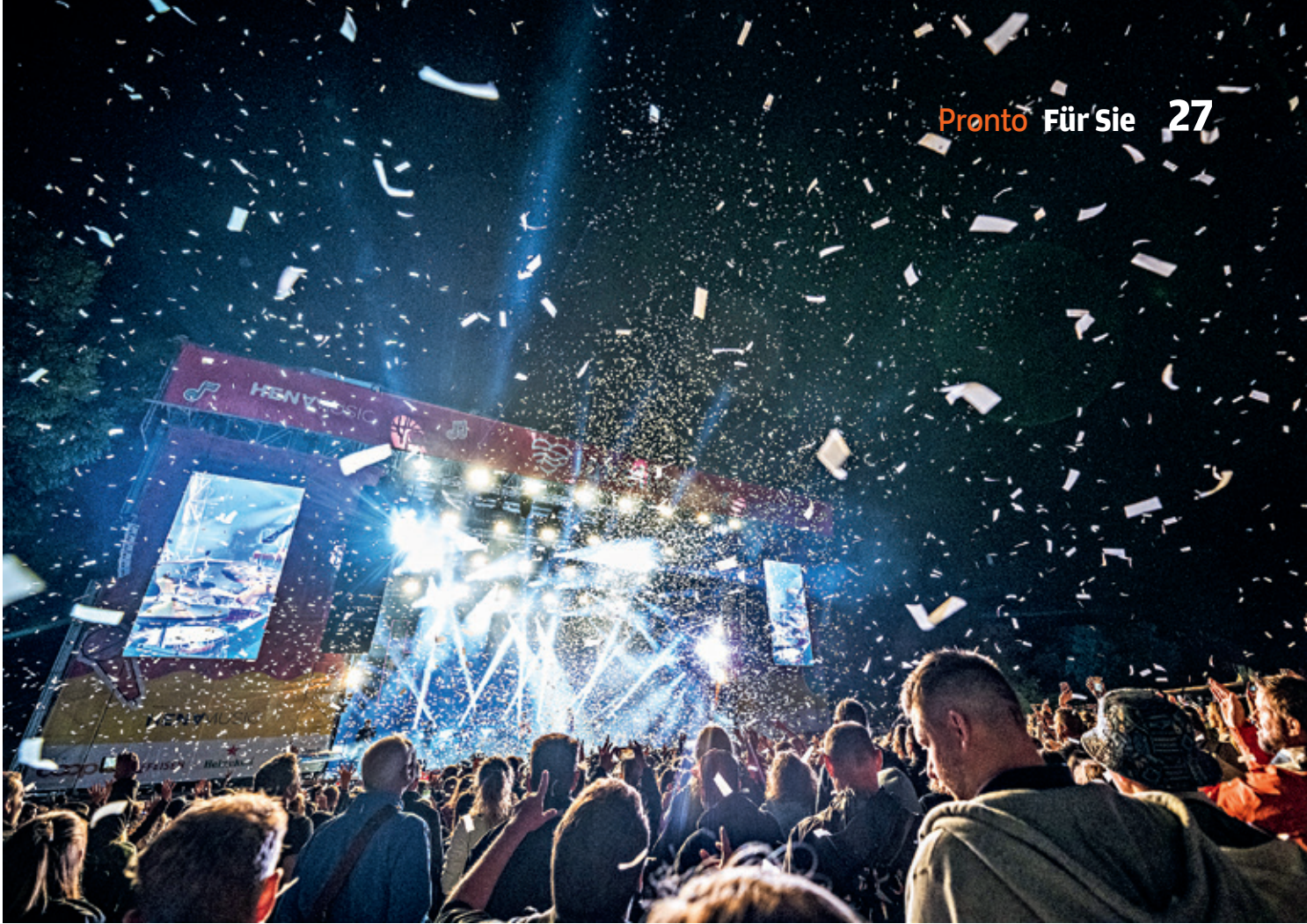
Musikalisches Feuerwerk: 36 Bands aus dem In- und Ausland sorgen an 11 Tagen für grossartige Stimmung.