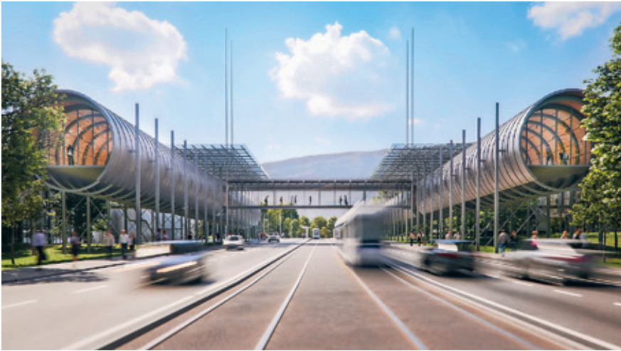
Das futuristische Science-Gateway wurde von Renzo Piano entworfen.