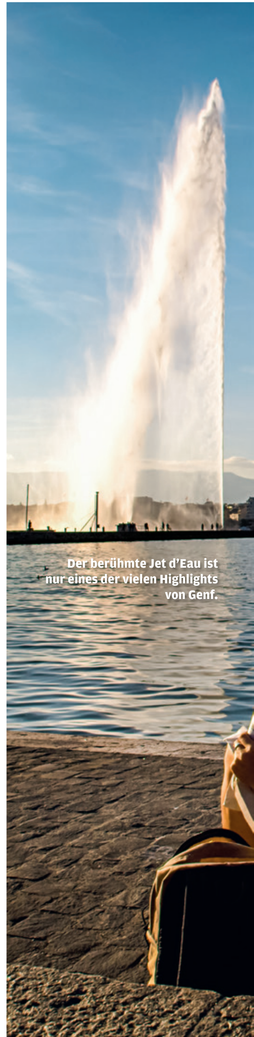
Der berühmte Jet d'Eau ist nur eines der vielen Highlights von Genf.

Genf ist eine Museumsstadt und hat auch bei schlechtem Wetter viel zu bieten. Im Internationalen Rotkreuz- und Halbmondmuseum können Besucher und Besucherinnen die bewegende 150-jährige Geschichte des Hilfswerks erkunden. Einen Einblick in die Uhrmacherkunst gewährt das Patek-Philippe-Museum. Wer mehr