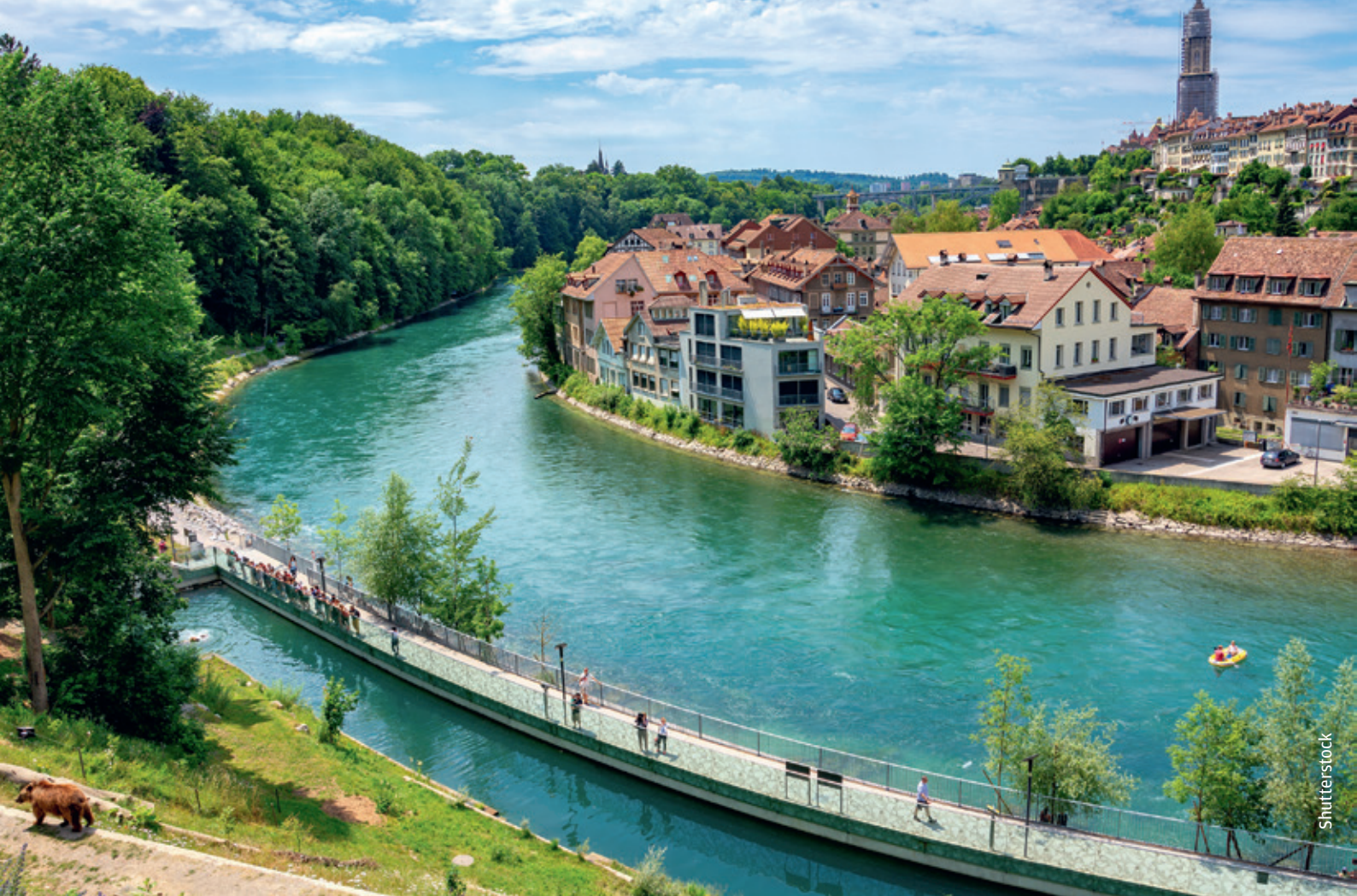
Blick auf die Aare und die Hauptstadt oberhalb des Berner Bärenparks.