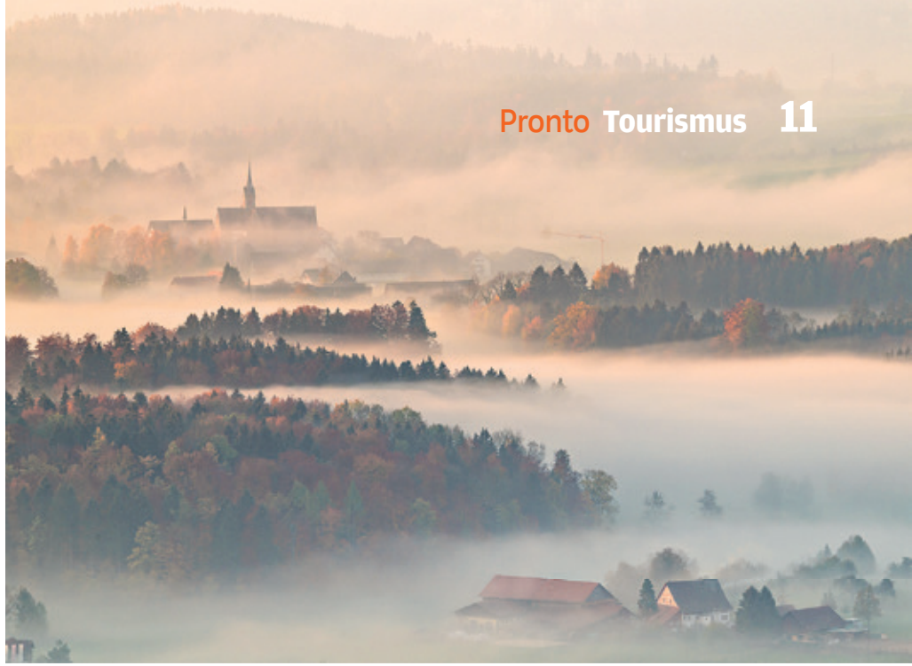
Zu entdecken: Vom Berner Zytglogerturm bis ins ländliche Langnau.

Die erste Käseroute der Schweiz führt durch die Heimat des berühmten Käses. Die Emmentaler Käseroute stellt den König der Käse in den Mittelpunkt, erschliesst aber auch Kontakte zur Landwirtschaft, zu gemütlichen Landgasthöfen und zu attraktiven touristischen Angeboten. Die Besucherinnen und Besucher der Emmentaler Käseroute bewegen sich mitten durch das Emmental, zu Fuss, mit dem Pferdewagen, dem Fahrrad, dem Privatauto oder den öffentlichen Verkehrsmitteln, ganz nach den persönlichen Wünschen.